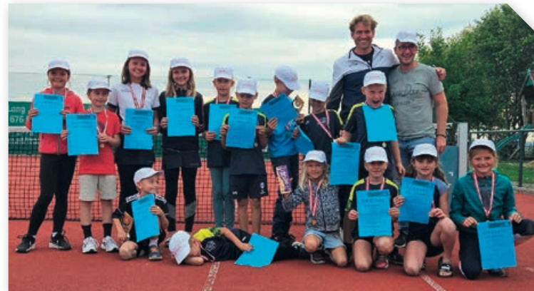
Die Teilnehmer des Kinder- und Jugendbewerbs der Orts- und Vereinsmeisterschaft mit Obmann und Obmann-Stv.

Die Orts- und Vereinsmeisterschaft wurde diese Saison bereits im Juni gestartet und Ende September mit den Finalspielen beendet. Es entwickelte sich eine Vielzahl