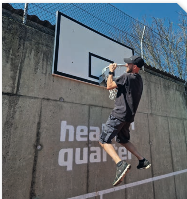
Basektballkorb am Tennisplatz Altenfelden