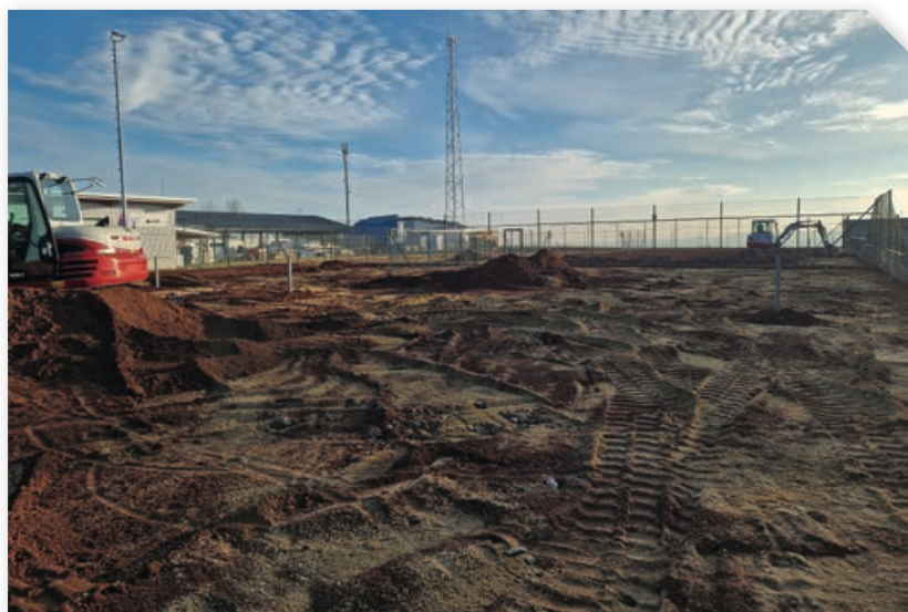
Februar 2024: Abtragung des alten Sandbelages auf der Tennisanlage

Neben den Tennisplätzen wurde mit einem neuen Basketballkorb und Tischtennistisch auch ein alternatives Sportangebot geschaffen.