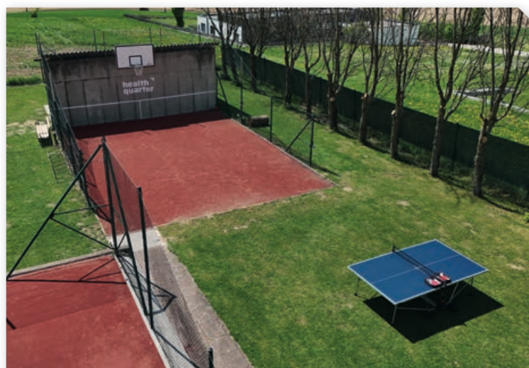
Tischtennistisch und Basketballkorb auf unserer Tennisanlage