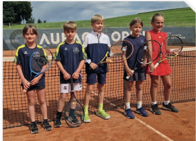
Kids Team (U10) des Tennisvereins Altenfelden

Unsere Tennis-Jugend nahm auch fleißig an Meisterschaftsbewerben teil. Im Winter 2024/25 wurde eine U12, sowie eine U14 Mannschaft gemeldet. Unsere U12 belegte den 3. Platz und unsere U14 konnte sogar den hervorragenden 1. Platz erzielen. Bei der OÖTV Jugendmeisterschaft im Herbst konnte wieder ein Kids Team U10 gestellt werden, welche den 6. Platz erreichten, sowie ein Green Team (U14), welche den ausgezeichneten 3. Platz belegten.