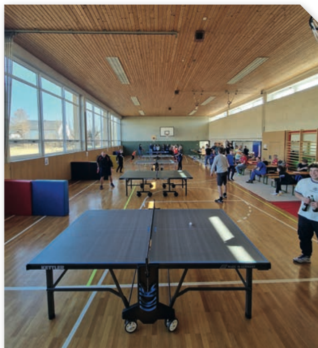
Tischtennisortscup 2025 in der Volksschule Altenfelden