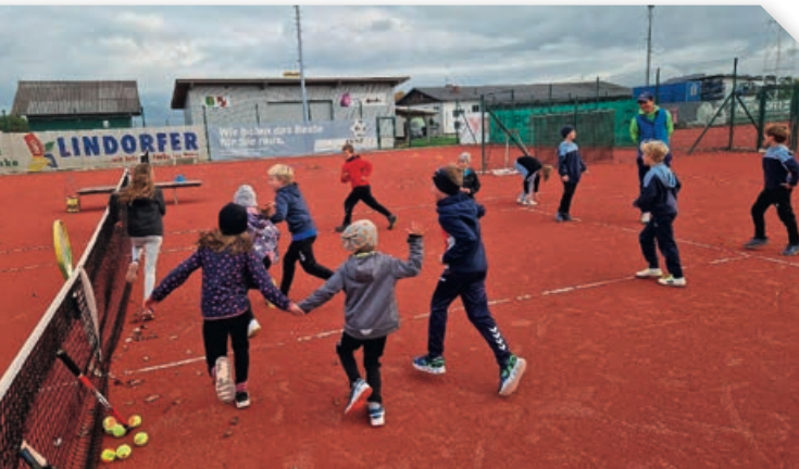
Tennisschnuppern für Kinder