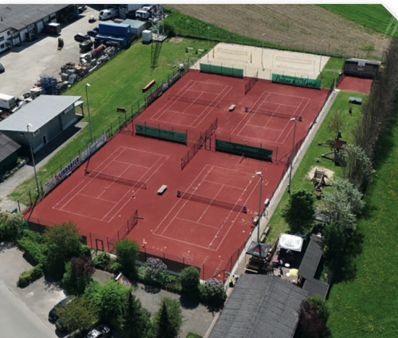
Drohnenaufnahme, neue Tennisplätze und Beachvolleyballanlage.