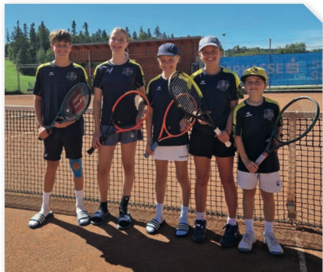
Green Team (U14) des Tennisvereins Altenfelden