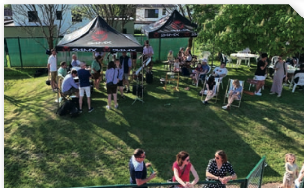
Eröffnungsfeier neue Tennisplätze